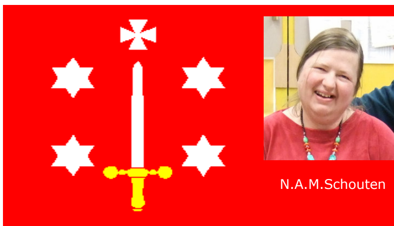
TWEEDE KLAS KAMPIOEN VAN HAARLEM 2007