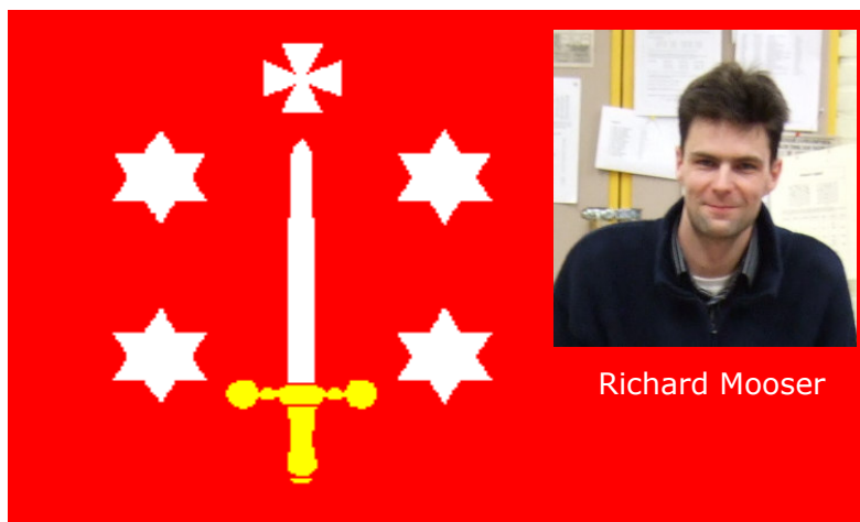
HOOFDKLASSE KAMPIOEN VAN HAARLEM 2007