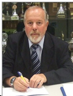
C.Verdel Haarlemsche Damclub

Coördinator Persoonlijke wedstrijden senioren